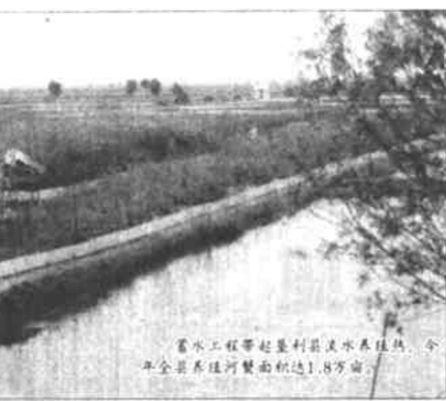
蓄水工程带动垦利县渔业发展，今年全县共养殖水面达1.8万亩。

目前，垦利县已拥有大、中、小型水库266座，其中库容100万立方米以上的33座，小型总蓄水能力达到2亿立方米。全县人均占有1000立方米水，也就是